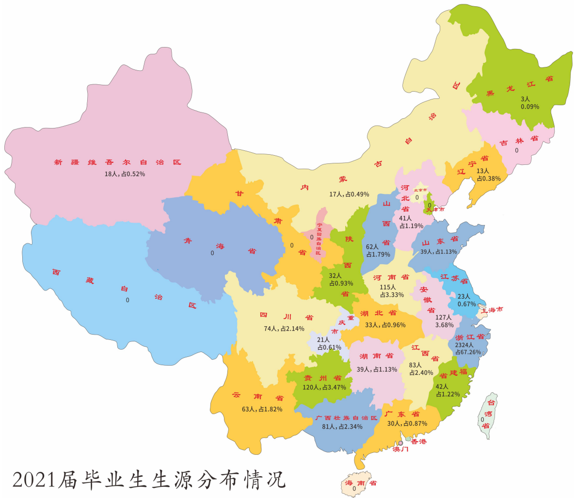
2021届毕业生生源分布情况